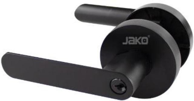
CERRADURA DE ALUMINIO SEVILLA MOD.9805 SKU: 9805ET-ALU-NE